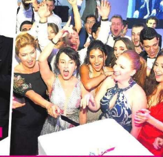
Pasta kesen öğrencilerin mutlu anları, objektiflere takıldı.