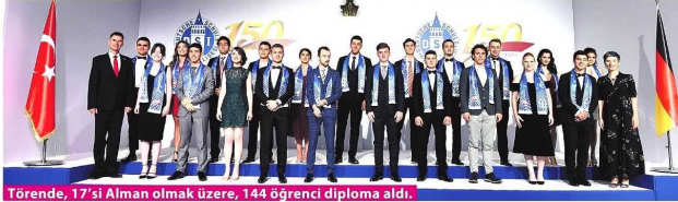
Törende, 17'si Alman olmak üzere, 144 öğrenci diploma aldı.